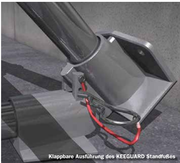
Klappbare Ausführung des KEEGUARD Standfußes