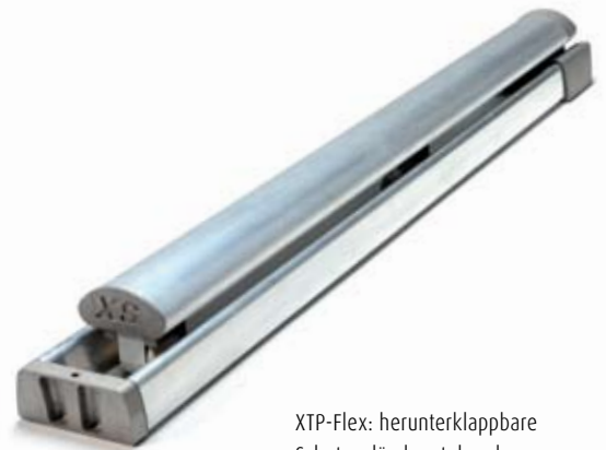
XTP-Flex: herunterklappbare Schutzgeländer stehend

Maximale Sicherheit und minimale Beeinträchtigung des architektonischen Erscheinungsbilds? Wenn Sie wünschen, dass die Schutzgeländer nur sichtbar sind, wenn sie tatsächlich benötigt werden, hat XSPlatforms auch dafür die Lösung: herunterklappbare Schutzgeländersysteme.